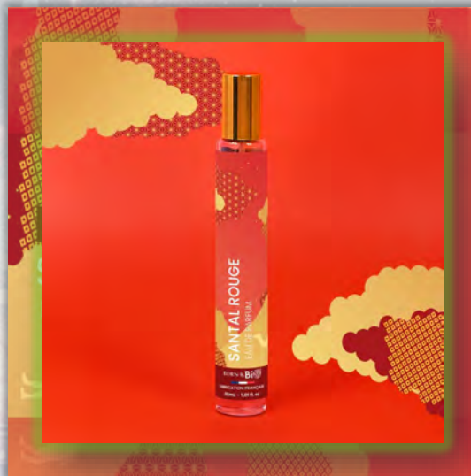
SANTAL ROUGE 30ml

Цветочно-фруктовый аромат с древесным теплом, вдохновлённый далёкими странами и изысканностью сандалового дерева.