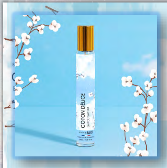
COTON DÉLICE 30ml

ALCOHOL DENAT (ДЕНАТУРИРОВАННЫЙ СПИРТ), PARFUM (ОТДУШКА), AQUA (ВОДА), LINALOOL (ЛИНАЛООЛ), TETRAMETHYL ACETYLOSTANHYDRONAPHTHALENES (ТЕТРАМЕТИЛ АЦЕТИЛОКТАГИДРОНАФТАЛЕНЬ), VANILLIN (ВАНИЛИН), LIMONENE (ЛИМОНЕН), LINALYL ACETATE (ЛИНАЛИЛАЦЕТАТ), GERANIOL (ГЕРАНИОЛ), HEXYL CINNAMAL (ГЕКСИЛЦИННАМАЛ), BENZYL SALICYLATE (БЕНЗИЛСАЛИЦИЛАТ), CITRONELLOL (ЦИТРОНЕЛЛОЛ), COUMARIN (КУМАРИН), PINENE (ПИНЕН), CITRAL (ЦИТРАЛ), ROSE KETONES (РОЗОВЫЕ КЕТОНЫ), GERANYL ACETATE (ГЕРАНИЛАЦЕТАТ), ALPHA ISOMETHYL IONONE (АЛЬФА-ИЗОМЕТИЛИОНОН), HYDROXYCITRONELLAL (ГИДРОКСИЦИТРОНЕЛЛАЛ), BENZYL BENZOATE (БЕНЗИЛБЕНЗОАТ), BETA-CARYOPHYLLENE (БЕТА-КАРИОФИЛЛЕН).