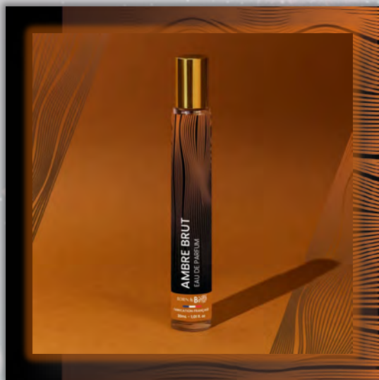
AMBRE BRUT 30ml

Новинка в мире ароматов, парфюмерная вода BORN TO BIO из Vichy от LABORATOIRE BIO SEASONS, – истинное свидетельство приверженности KOSMEO FRANCIA качеству и инновациям. KOSMEO FRANCIA, официальный представитель и дистрибьютор в странах Евразии, представляет этот новый аромат как праздник природы и благополучия. Благодаря изысканным нотам и тщательно подобранным органическим ингредиентам, BORN TO BIO воплощает в себе самую суть ответственной и экологичной красоты. Эта элегантная и аутентичная парфюмерная вода пленяет своим уникальным характером, привлекая тех, кто ищет новые, насыщенные обонятельные ощущения.