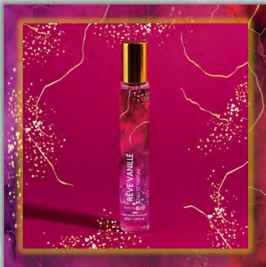
RÊVE VANILLÉ 30ml

Новинка в мире ароматов, парфюмерная вода BORN TO BIO из Vichy от LABORATOIRE BIO SEASONS, – истинное свидетельство приверженности KOSMEO FRANCIA качеству и инновациям. KOSMEO FRANCIA, официальный представитель и дистрибьютор в странах Евразии, представляет этот новый аромат как праздник природы и благополучия. Благодаря изысканным нотам и тщательно подобранным органическим ингредиентам, BORN TO BIO воплощает в себе самую суть ответственной и экологичной красоты. Эта элегантная и аутентичная парфюмерная вода пленяет своим уникальным характером, привлекая тех, кто ищет новые, насыщенные обонятельные ощущения.