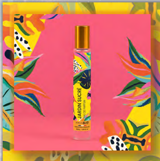
JARDIN SUCRÉ 30ml

ALCOHOL DENAT (ДЕНАТУРИРОВАННЫЙ СПИРТ), PARFUM (ОТДУШКА), AQUA (ВОДА), TETRAMETHYL ACETYLOSTANУDRONАРТНАLENES (ТЕТРАМЕТИЛ АЦЕТИЛОКТАГИДРОНАФТАЛЕНЬ), LINALOOL (ЛИНАЛООЛ), LIMONENE (ЛИМОНЕН), VANILLIN (ВАНИЛИН), HEXYL CINNAMAL (ГЕКСИЛЦИННАМАЛ), BENZYL SALICYLATE (БЕНЗИЛСАЛИЦИЛАТ), LINALYL ACETATE (ЛИНАЛИЛАЦЕТАТ), COUMARIN (КУМАРИН), GERANIOL (ГЕРАНИОЛ), BENZYL BENZOATE (БЕНЗИЛБЕНЗОАТ), ACETYL CEDRENE (АЦЕТИЛКЕДРЕН), ALPHA ISOMETHYL IONONE (АЛЬФА-ИЗОМЕТИЛИОНОН), CITRAL (ЦИТРАЛ), BENZOIN RESINOID (БЕНЗОИНОВАЯ СМОЛА), BETA-CARYOPHYLLENE (БЕТА-КАРИОФИЛЛЕН), BENZYL ALCOHOL (БЕНЗИЛОВЫЙ СПИРТ).