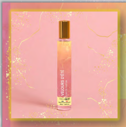
VELOURS D'ÉTÉ 30ml

Новинка в мире ароматов, парфюмерная вода BORN TO BIO из Vichy от LABORATOIRE BIO SEASONS, – истинное свидетельство приверженности KOSMEO FRANCIA качеству и инновациям. KOSMEO FRANCIA, официальный представитель и дистрибьютор в странах Евразии, представляет этот новый аромат как праздник природы и благополучия. Благодаря изысканным нотам и тщательно подобранным органическим ингредиентам, BORN TO BIO воплощает в себе самую суть ответственной и экологичной красоты. Эта элегантная и аутентичная парфюмерная вода пленяет своим уникальным характером, привлекая тех, кто ищет новые, насыщенные обонятельные ощущения.