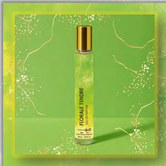
FLORALE TENDRE 30ml

Новинка в мире ароматов, парфюмерная вода BORN TO BIO из Vichy от LABORATOIRE BIO SEASONS, – истинное свидетельство приверженности KOSMEO FRANCIA качеству и инновациям. KOSMEO FRANCIA, официальный представитель и дистрибьютор в странах Евразии, представляет этот новый аромат как праздник природы и благополучия. Благодаря изысканным нотам и тщательно подобранным органическим ингредиентам, BORN TO BIO воплощает в себе самую суть ответственной и экологичной красоты. Эта элегантная и аутентичная парфюмерная вода пленяет своим уникальным характером, привлекая тех, кто ищет новые, насыщенные обонятельные ощущения.