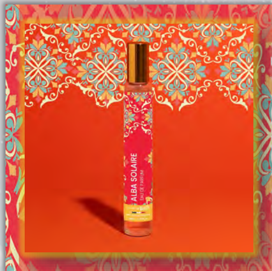
ALBA SOLAIRE 30ml

Новинка в мире ароматов, парфюмерная вода BORN TO BIO из Vichy от LABORATOIRE BIO SEASONS, – истинное свидетельство приверженности KOSMEO FRANCIA качеству и инновациям. KOSMEO FRANCIA, официальный представитель и дистрибьютор в странах Евразии, представляет этот новый аромат как праздник природы и благополучия. Благодаря изысканным нотам и тщательно подобранным органическим ингредиентам, BORN TO BIO воплощает в себе самую суть ответственной и экологичной красоты. Эта элегантная и аутентичная парфюмерная вода пленяет своим уникальным характером, привлекая тех, кто ищет новые, насыщенные обонятельные ощущения.