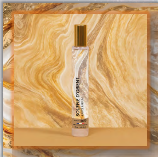
SOUFFLE D'ORIENT 30ml

Новинка в мире ароматов, парфюмерная вода BORN TO BIO из Vichy от LABORATOIRE BIO SEASONS, – истинное свидетельство приверженности KOSMEO FRANCIA качеству и инновациям. KOSMEO FRANCIA, официальный представитель и дистрибьютор в странах Евразии, представляет этот новый аромат как праздник природы и благополучия. Благодаря изысканным нотам и тщательно подобранным органическим ингредиентам, BORN TO BIO воплощает в себе самую суть ответственной и экологичной красоты. Эта элегантная и аутентичная парфюмерная вода пленяет своим уникальным характером, привлекая тех, кто ищет новые, насыщенные обонятельные ощущения.