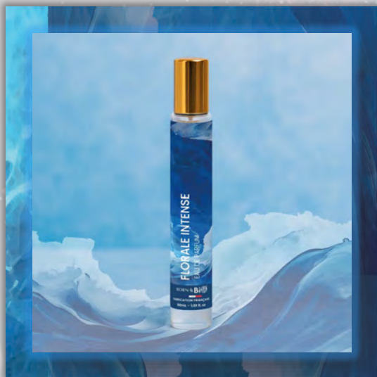
FLORALE INTENSE 30ml

Новинка в мире ароматов, парфюмерная вода BORN TO BIO из Vichy от LABORATOIRE BIO SEASONS, – истинное свидетельство приверженности KOSMEO FRANCIA качеству и инновациям. KOSMEO FRANCIA, официальный представитель и дистрибьютор в странах Евразии, представляет этот новый аромат как праздник природы и благополучия. Благодаря изысканным нотам и тщательно подобранным органическим ингредиентам, BORN TO BIO воплощает в себе самую суть ответственной и экологичной красоты. Эта элегантная и аутентичная парфюмерная вода пленяет своим уникальным характером, привлекая тех, кто ищет новые, насыщенные обонятельные ощущения.