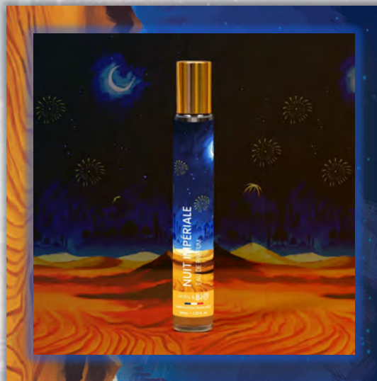
NUIT IMPERIALE 30ml

ALCOHOL DENAT (ДЕНАТУРИРОВАННЫЙ СПИРТ), AQUA (ВОДА), PARFUM (ОТДУШКА), TETRAMETHYL ACETYLOCTAHYDRONARHTHALENES (ТЕТРАМЕТИЛ АЦЕТИЛОКТАГИДРОНАФТАЛЕНЬ), LIMONENE (ЛИМОНЕН), LINALOOL (ЛИНАЛООЛ), CITRUS AURANTIUM FLOWER OIL (ЭФИРНОЕ МАСЛО ЦВЕТКОВ АПЕЛЬСИНА), BENZYL SALICYLATE (БЕНЗИЛСАЛИЦИЛАТ), LINALYL ACETATE (ЛИНАЛИЛАЦЕТАТ), VANILLIN (ВАНИЛИН), HYDROXYCITRONELLAL (ГИДРОКСИЦИТРОНЕЛЛАЛ), ACETYL CEDRENE (АЦЕТИЛКЕДРЕН), CITRUS LIMON PEEL OIL (ЭФИРНОЕ МАСЛО ЦЕДРЫ ЛИМОНА), ISOEUGENOL (ИЗОЭВГЕНОЛ), COUMARIN (КУМАРИН), HEXAMETHYLINDANOPYRAN (ГЕКСАМЕТИЛИНДАНОПИРАН), PINENE (ПИНЕН), CITRONELLOL (ЦИТРОНЕЛЛОЛ), GERANIOL (ГЕРАНИОЛ), CITRAL (ЦИТРАЛ), TERPINEOL (ТЕРПИНОЛ), LAVANDULA OIL (ЭФИРНОЕ МАСЛО ЛАВАНДЫ), BENZYL BENZOATE (БЕНЗИЛБЕНЗОАТ), ISOEUGENYL ACETATE (ИЗОЭВГЕНИЛАЦЕТАТ), GERANYL ACETATE (ГЕРАНИЛАЦЕТАТ), BETA-CARYOPHYLLENE (БЕТА-КАРИОФИЛЛЕН), TERPINOLENE (ТЕРПИНОЛЕН).