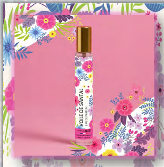
VOILE DE SANTAL 30ml

ALCOHOL DENAT (ДЕНАТУРИРОВАННЫЙ СПИРТ), PARFUM (ПАРФЮМ, АРОМАТИЗАТОР), AQUA (ВОДА), LINALOOL (ЛИНАЛОЛ), LINALYL ACETATE (ЛИНАЛИЛ АЦЕТАТ), LIMONENE (ЛИМОНЕН), CITRUS AURANTIUM PEEL OIL (ЭФИРНОЕ МАСЛО КОРОК АПЕЛЬСИНА), TETRAMETHYL ACETYLOSTANHYDRONAPHTHALENES (ТЕТРАМЕТИЛАЦЕТИЛОКТАГИДРОНАФТАЛЕНЬ), BENZYL SALICYLATE (БЕНЗИЛСАЛИЦИЛАТ), HEXYL CINNAMAL (ГЕКСИЛЦИННАМАЛ), VANILLIN (ВАНИЛИН), DIMETHYL PHENETHYL ACETATE (ДИМЕТИЛФЕНЕТИЛ АЦЕТАТ), COUMARIN (КУМАРИН), PINENE (ПИНЕН), BENZYL ALCOHOL (БЕНЗИЛОВЫЙ СПИРТ), CITRONELLOL (ЦИТРОНЕЛЛОЛ), GERANYL ACETATE (ГЕРАНИЛ АЦЕТАТ), ROSE KETONES (РОЗОВЫЕ КЕТОНЫ), CITRAL (ЦИТРАЛЬ), TERPINEOL (ТЕРПИНЕОЛ), SCLAREOL (СКЛАРЕОЛ), BENZALDEHYDE (БЕНЗАЛЬДЕГИД), GERANIOL (ГЕРАНИОЛ), TERPINOLENE (ТЕРПИНОЛЕН), ALPHA-TERPINENE (АЛЬФА-ТЕРПИНЕН), FARNESOL (ФАРНЕЗОЛ).