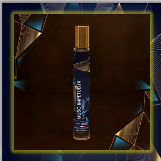
MUSC IMPETUEUX 30ml

Новинка в мире ароматов, парфюмерная вода BORN TO BIO из Vichy от LABORATOIRE BIO SEASONS, – истинное свидетельство приверженности KOSMEO FRANCIA качеству и инновациям. KOSMEO FRANCIA, официальный представитель и дистрибьютор в странах Евразии, представляет этот новый аромат как праздник природы и благополучия. Благодаря изысканным нотам и тщательно подобранным органическим ингредиентам, BORN TO BIO воплощает в себе самую суть ответственной и экологичной красоты. Эта элегантная и аутентичная парфюмерная вода пленяет своим уникальным характером, привлекая тех, кто ищет новые, насыщенные обонятельные ощущения.