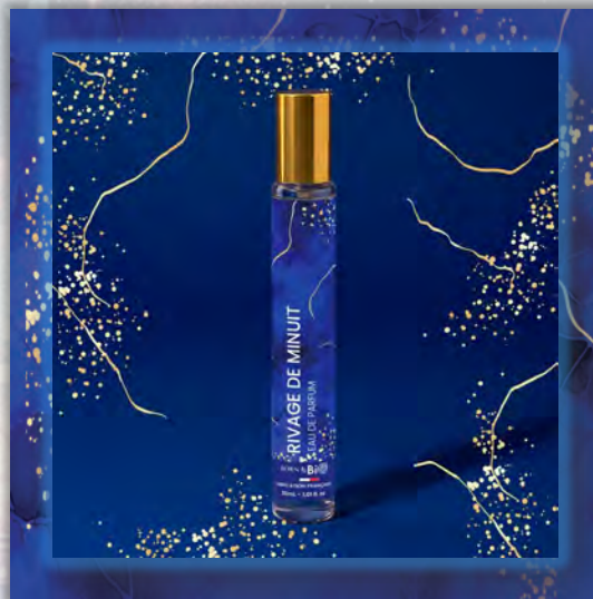
RIVAGE DE MINUIT 30ml

ALCOHOL DENAT (ДЕНАТУРИРОВАННЫЙ СПИРТ), PARFUM (ОТДУШКА), AQUA (ВОДА), TETRAMETHYL ACETYLOSTANHYDRONARHTHALENES (ТЕТРАМЕТИЛ АЦЕТИЛОКТАГИДРОНАФТАЛЕНЬ), LINALOOL (ЛИНАЛООЛ), BENZYL SALICYLATE (БЕНЗИЛСАЛИЦИЛАТ), VANILLIN (ВАНИЛИН), HEXYL CINNAMAL (ГЕКСИЛЦИННАМАЛ), LIMONENE (ЛИМОНЕН), COUMARIN (КУМАРИН), ALPHA ISOMETHYL IONONE (АЛЬФА-ИЗОМЕТИЛИОНОН), BENZYL ALCOHOL (БЕНЗИЛОВЫЙ СПИРТ), GERANIOL (ГЕРАНИОЛ), POGOSTEMON SAVBLIN OIL (ЭФИРНОЕ МАСЛО ПАЧУЛИ), CITRAL (ЦИТРАЛ), BETA-CARYOPHYLLENE (БЕТА-КАРИОФИЛЛЕН), CINNAMYL ALCOHOL (ЦИННАМИЛОВЫЙ СПИРТ), BENZOIN RESINOID (БЕНЗОИНОВАЯ СМОЛА).