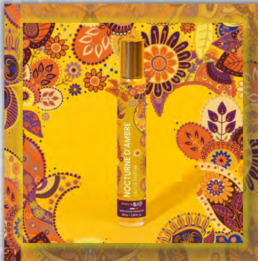
NOCTURNE D'AMBRE 30ml

ALCOHOL DENAT (ДЕНАТУРИРОВАННЫЙ СПИРТ), PARFUM (ОТДУШКА), AQUA (ВОДА), CITRUS LIMON PEEL OIL (ЭФИРНОЕ МАСЛО ЦЕДРЫ ЛИМОНА), LIMONENE (ЛИМОНЕН), LINALYL ACETATE (ЛИНАЛИЛАЦЕТАТ), LINALOOL (ЛИНАЛОЛ), PINENE (ПИНЕН), VANILLIN (ВАНИЛИН), BENZYL SALICYLATE (БЕНЗИЛСАЛИЦИЛАТ), GERANYL ACETATE (ГЕРАНИЛАЦЕТАТ), GERANIOL (ГЕРАНИОЛ), CITRONELLOL (ЦИТРОНЕЛЛОЛ), CITRUS AURANTIUM PEEL OIL (ЭФИРНОЕ МАСЛО ЦЕДРЫ АПЕЛЬСИНА), HYDROXYCITRONELLAL (ГИДРОКСИЦИТРОНЕЛЛАЛ), COUMARIN (КУМАРИН), CITRAL (ЦИТРАЛ), TERPINEOL (ТЕРПИНЕОЛ), TERPINOLENE (ТЕРПИНОЛЕН), ROSE KETONES (РОЗОВЫЕ КЕТОНЫ), ISOEUGENYL ACETATE (ИЗОЭВГЕНИЛАЦЕТАТ), ALPHA-TERPINENE (АЛЬФА-ТЕРПИНЕН).