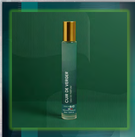
CUIR DE VERGER 30ml

Древесный и фруктовый мужской аромат, в котором свежее яблоко сочетается с теплотой кедра и мускуса.