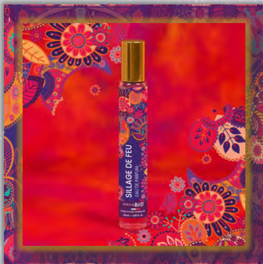
SILLAGE DE FEU 30ml

Новинка в мире ароматов, парфюмерная вода BORN TO BIO из Vichy от LABORATOIRE BIO SEASONS, – истинное свидетельство приверженности KOSMEO FRANCIA качеству и инновациям. KOSMEO FRANCIA, официальный представитель и дистрибьютор в странах Евразии, представляет этот новый аромат как праздник природы и благополучия. Благодаря изысканным нотам и тщательно подобранным органическим ингредиентам, BORN TO BIO воплощает в себе самую суть ответственной и экологичной красоты. Эта элегантная и аутентичная парфюмерная вода пленяет своим уникальным характером, привлекая тех, кто ищет новые, насыщенные обонятельные ощущения.