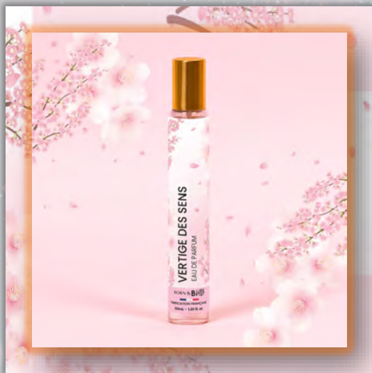
VERTIGE DES SENS 30ml

Новинка в мире ароматов, парфюмерная вода BORN TO BIO из Vichy от LABORATOIRE BIO SEASONS, – истинное свидетельство приверженности KOSMEO FRANCIA качеству и инновациям. KOSMEO FRANCIA, официальный представитель и дистрибьютор в странах Евразии, представляет этот новый аромат как праздник природы и благополучия. Благодаря изысканным нотам и тщательно подобранным органическим ингредиентам, BORN TO BIO воплощает в себе самую суть ответственной и экологичной красоты. Эта элегантная и аутентичная парфюмерная вода пленяет своим уникальным характером, привлекая тех, кто ищет новые, насыщенные обонятельные ощущения.