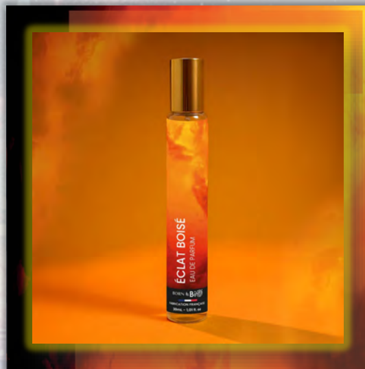
ÉCLAT BOISÉ 30ml

Древесный и пряный аромат с сияющей свежестью, в котором цитрусовые ноты встречаются с глубиной ветивера.