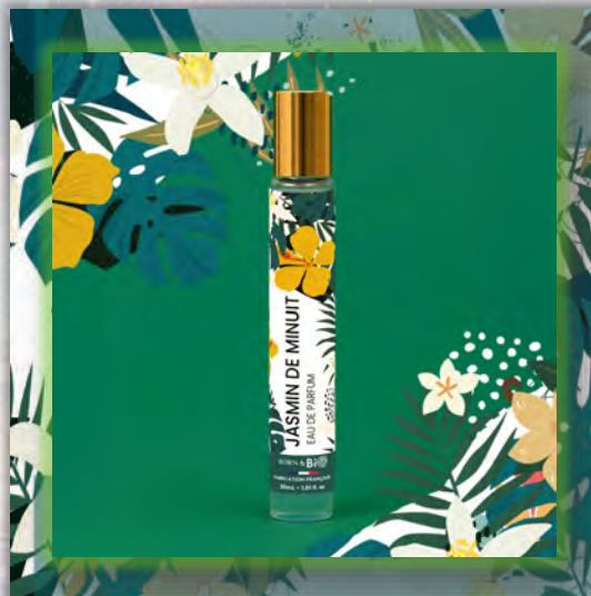
JASMIN DE MINUIT 30ml

Цветочный и чувственный женский аромат, в котором жасмин сияет на основе ванили и мускуса, создавая элегантность, неподвластную времени.