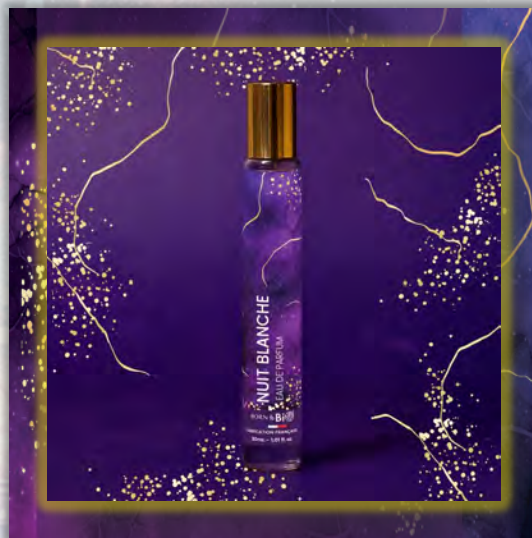
NUIT BLANCHE 30ml

ALCOHOL DENAT (ДЕНАТУРИРОВАННЫЙ СПИРТ), PARFUM (ОТДУШКА), AQUA (ВОДА), LINALOOL (ЛИНАЛОЛ), LIMONENE (ЛИМОНЕН), BENZYL SALICYLATE (БЕНЗИЛСАЛИЦИЛАТ), HEXYL CINNAMAL (ГЕКСИЛЦИННАМАЛ), LINALYL ACETATE (ЛИНАЛИЛАЦЕТАТ), VANILLIN (ВАНИЛИН), CITRAL (ЦИТРАЛ), GERANIOL (ГЕРАНИОЛ), COUMARIN (КУМАРИН), BENZYL BENZOATE (БЕНЗИЛБЕНЗОАТ), TERPINEOL (ТЕРПИНЕОЛ), CITRONELLOL (ЦИТРОНЕЛЛОЛ), PINENE (ПИНЕН), GERANYL ACETATE (ГЕРАНИЛАЦЕТАТ), BETA-CARYOPHYLLENE (БЕТА-КАРИОФИЛЛЕН).