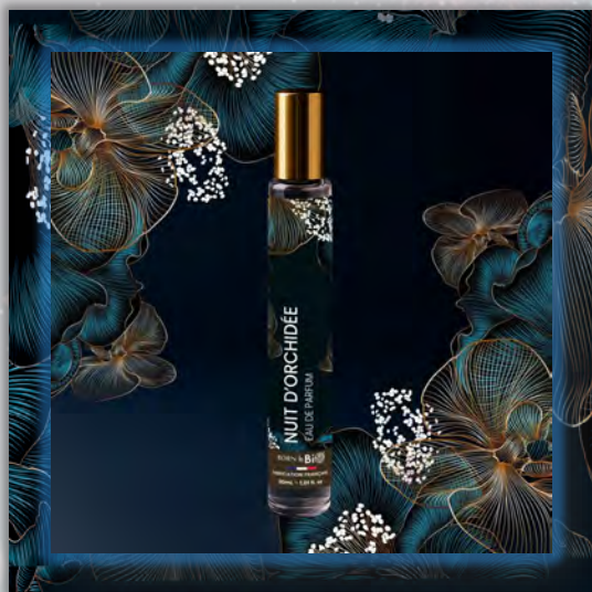
NUIT D'ORCHIDÉE 30ml

Новинка в мире ароматов, парфюмерная вода BORN TO BIO из Vichy от LABORATOIRE BIO SEASONS, – истинное свидетельство приверженности KOSMEO FRANCIA качеству и инновациям. KOSMEO FRANCIA, официальный представитель и дистрибьютор в странах Евразии, представляет этот новый аромат как праздник природы и благополучия. Благодаря изысканным нотам и тщательно подобранным органическим ингредиентам, BORN TO BIO воплощает в себе самую суть ответственной и экологичной красоты. Эта элегантная и аутентичная парфюмерная вода пленяет своим уникальным характером, привлекая тех, кто ищет новые, насыщенные обонятельные ощущения.