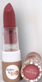
№2 NUDE ROSE НЮД РОЗОВЫЙ