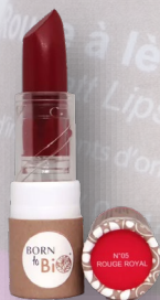
№5 ROUGE ROYAL КОРОЛЕВСКИЙ КРАСНЫЙ