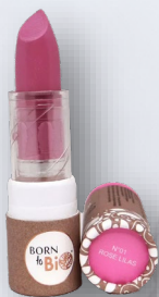
№1 ROSE LILAS РОЗОВО-ЛИЛОВЫЙ

Матовые помады Born To Bio представлены в изысканной палитре оттенков, идеально подходящих для любого случая и стиля. Современные цвета в сочетании с органическими ингредиентами создают элегантный и натуральный образ, заботясь о вашей коже. Born to Bio предлагает вам 6 разных оттенка — на любой вкус, каждый из которых обладает насыщенным пигментом. Она соответствует строгим стандартам независимых организаций, что гарантирует бережное отношение как к вашей коже, так и к окружающей среде.