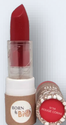
№4 ROUGE CORAIL КОРАЛЛОВЫЙ КРАСНЫЙ