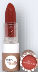
№3 ORANGE NUDE НЮД ОРАНЖЕВЫЙ