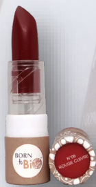
№6 ROUGE CUIVRE МЕДНО-КРАСНЫЙ