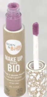
№2 LILAS ЛИЛОВЫЙ