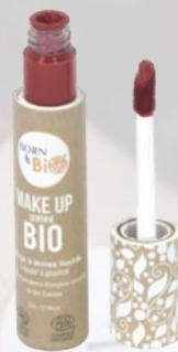
№4 CERISE ВИШНЁВЫЙ