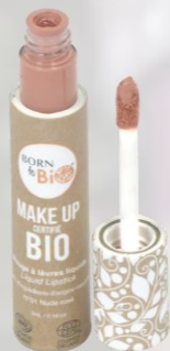
№1 NUDE ROSE НЮД РОЗОВЫЙ

Наши жидкие помады придают матовый финиш и держатся на губах в течение всего дня. Born to Bio предлагает вам 4 разных оттенка — на любой вкус, каждый из которых обладает насыщенным пигментом. Она соответствует строгим стандартам независимых организаций, что гарантирует бережное отношение как к вашей коже, так и к окружающей среде.