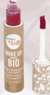
№3 ROUGE INTENSE НАСЫЩЕННЫЙ КРАСНЫЙ