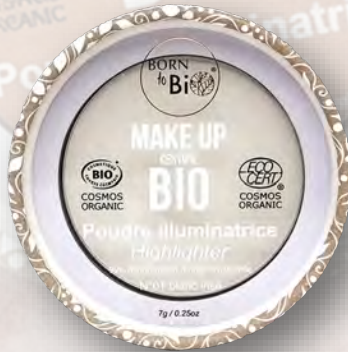
№1 BLANC IRISÉ ЖЕМЧУЖНО-БЕЛАЯ

Наша органическая сияющая пудра позволяет легко придать сияние вашему лицу! Она идеально подойдёт как для создания выразительного вечернего макияжа, так и для лёгкого естественного сияния в повседневном образе. Содержащая 99 % ингредиентов натурального происхождения, наша пудра не только подчёркивает красоту, но и заботится о вашей коже — и о вас. Её формула состоит на 99 % из ингредиентов натурального происхождения, из которых 21 % получены из органического сельского хозяйства. Продукт отмечен знаком Cosmebio и сертифицирован Ecocert — независимыми организациями, что гарантирует его безопасность как для кожи, так и для окружающей среды.