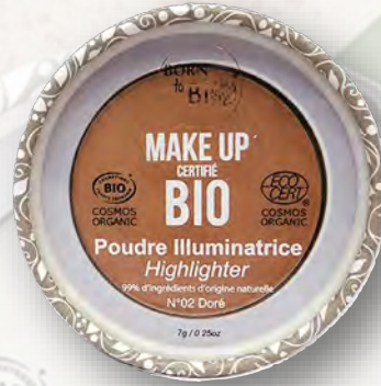
№2 DORÉ ЗОЛОТИСТАЯ