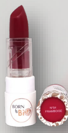
№4 FRAMBOISE МАЛИНА