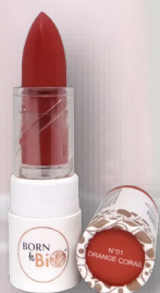
№1 ORANGE CORAIL ОРАНЖЕВЫЙ КОРАЛЛ

Born to Bio предлагает вам 6 разных оттенков — на любой вкус, каждый из которых обладает насыщенным пигментом. Она соответствует строгим стандартам независимых организаций, что гарантирует бережное отношение как к вашей коже, так и к окружающей среде.