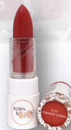
№5 RAISIN ВИНОГРАД