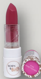
№3 ROSE FUCHSIA РОЗОВАЯ ФУКСИЯ