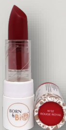
№2 ROUGE ROYAL КОРОЛЕВСКИЙ КРАСНЫЙ