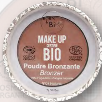
№1 NATUREL ЕСТЕСТВЕННЫЙ ОТТЕНОК

Наша сертифицированная органическая бронзирующая пудра обладает матовым финишем. Она легко наносится как поверх тонального крема, так и самостоятельно — для мгновенного эффекта свежего и отдохнувшего лица. Идеально подходит для создания вечернего макияжа с чёткой структурой, а также для придания естественного тепла тону кожи при повседневном использовании. Её формула состоит на 99 % из ингредиентов натурального происхождения, из которых 10 % получены из органического сельского хозяйства. Продукт имеет маркировку Cosmebio и сертификацию Ecocert, что подтверждает его соответствие строгим требованиям этих независимых организаций и гарантирует безопасность как для вашей кожи, так и для окружающей среды.