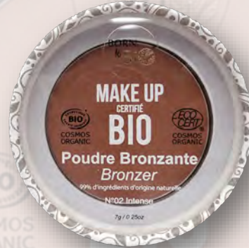
№2 INTENSE НАСЫЩЕННЫЙ ОТТЕНОК