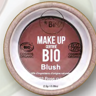
№2 ROSE CUIVRÉ МЕДНО-РОЗОВЫЙ