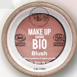
№1 BOIS DE ROSE РОЗОВОЕ ДЕРЕВО

Состав на 99% состоит из ингредиентов натурального происхождения, включая 10% компонентов, полученных из органического сельского хозяйства. Продукт сертифицирован Ecocert и отмечен знаком Cosmébio, что подтверждает соответствие строгим требованиям этих независимых организаций и гарантирует уважение как к вашей коже, так и к окружающей среде.