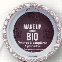
№4 POURPRE ПУРПУРНЫЙ