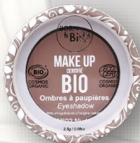
№2 NUDE НЮД