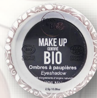
№6 NOIR ЧЁРНЫЙ