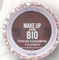
№3 TAUPE СЕРО-КОРИЧНЕВЫЙ