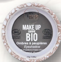
№5 GRIS СЕРЫЙ