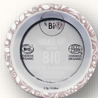
№1 BLANC БЕЛЫЙ

Её формула на 99 % состоит из ингредиентов натурального происхождения, из которых 10 % — из органического сельского хозяйства. Продукт сертифицирован Ecocert и отмечен знаком Cosmebio, что подтверждает соответствие строгим стандартам этих независимых организаций и гарантирует бережное отношение как к вашей коже, так и к окружающей среде.